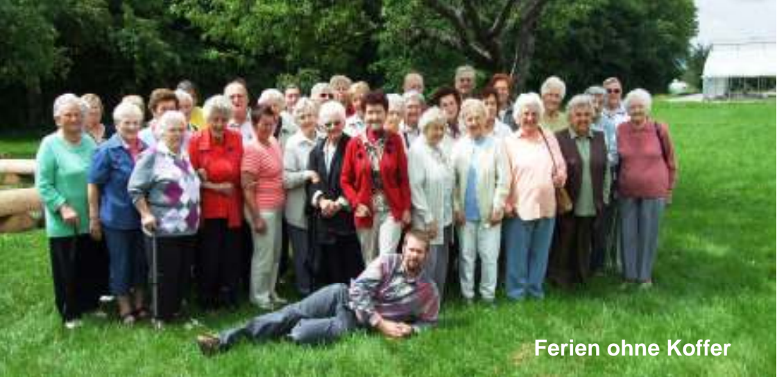
Ferien ohne Koffer

Erinnern Sie sich an viele schöne Veranstaltungen in unserer Gemeinde vor den Sommerferien?