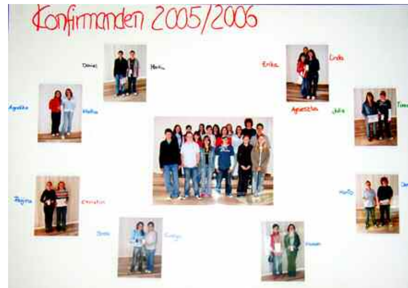
Das Plakat der Konfirmanden beim Gemeindeforum