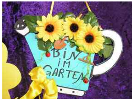
Dieses Schild wurde z.B. beim Ostermarkt angeboten

Während der ganzen Adventszeit wollen wir in der Arche „Selbstgemachtes“ anbieten, z.B. Fruchtbrot, kleine Christollen, Lebkuchen, Linzer Torte, Krokant, gebrannte Mandeln, Weihnachtsgebäck, leckere „neue Marmeladenkreationen“, Quittenbrot, Säfte, So-