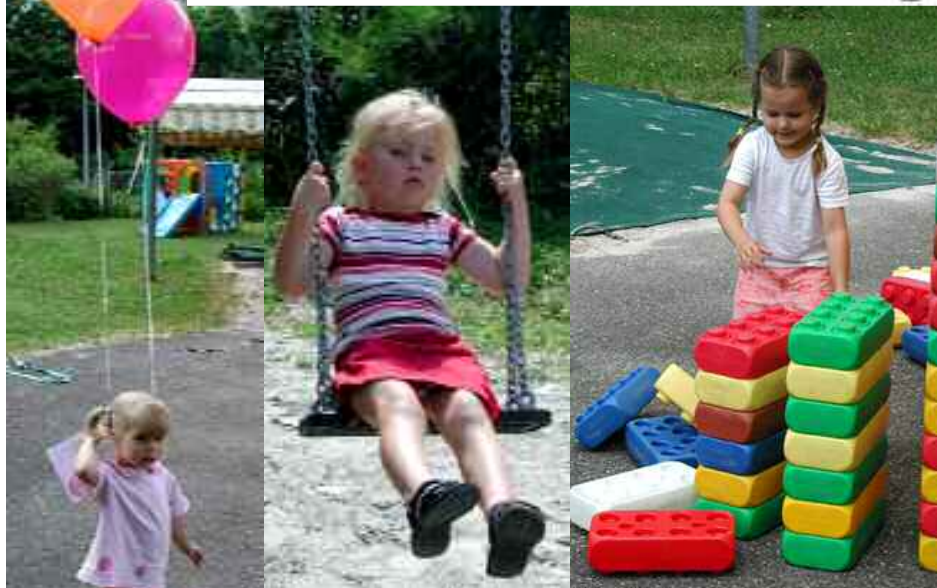
Fotos vom diesjährigen Gemeindefest im Garten des Kiga Arche

Wenn du ein Kind siehst, begegnest du Gott auf frischer Tat.