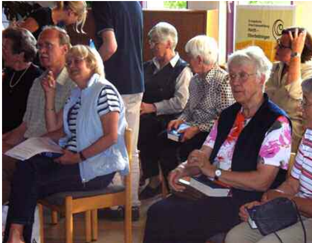
Mit Spannung wird der Forumsbeginn erwartet