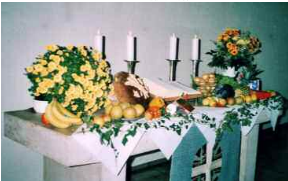
Erntedankaltar Friedenskirche 2003