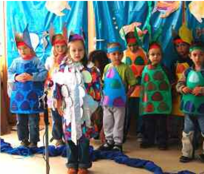
Bei unserem Gemeindefest in der Friedenskirche im Juli führten die Kinder des Kindergartens das Singspiel vom Regenbogenfisch auf.