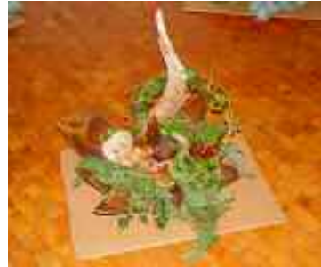
2003 entstanden viele ansprechende Grabgestecke